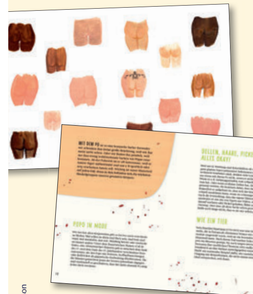
Illustration: Amelie Persson

☀ Körper in all ihren Variationen – bunt und vielfältig ☀ Liebevolle Illustrationen laden zum Betrachten ein ☀ Denkanstöße und kurze Sachinformationen zu Normen, die wir mit Körper- teilen verbinden