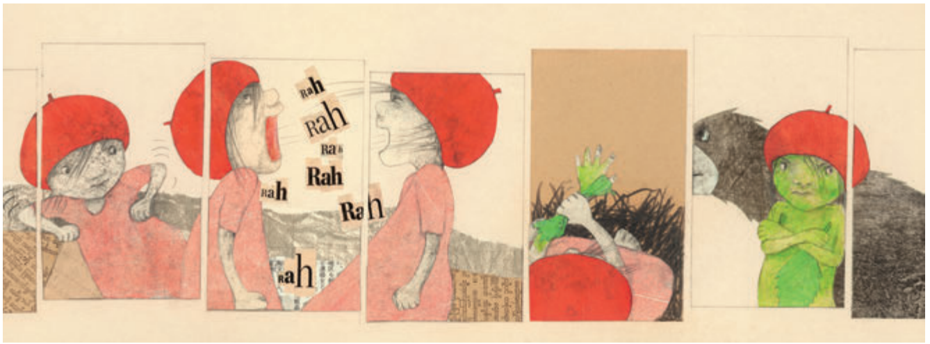
Von vorne, von rechts, von links und von oben setzt Helga Bansch ihr Vogelmädchen in Szene. Ill. Helga Bansch aus »Rabenrosa«, Jungbrunnen 2015

bei: Einige Protagonisten, Gegenstände oder Erzählräume sind in Blau-, Grün- und Rottönen hervorgehoben; Nebenschauplätze, weniger wichtige Figuren oder imaginierte Bewegungen dagegen nur mit Feder skizziert und nicht koloriert. Durch dieses Gewirr von Strichen, Farbflächen und eingefügten Handschriften wandert das Auge und ist ununterbrochen in Bewegung. Aber auch die Figuren sind in Bewegung, eilen von hierhin nach dort, während ihre Gliedmaßen simultan in unterschiedlichen Positionen gezeigt werden und diese so den Lauf einer Bewegung schon andeuten.