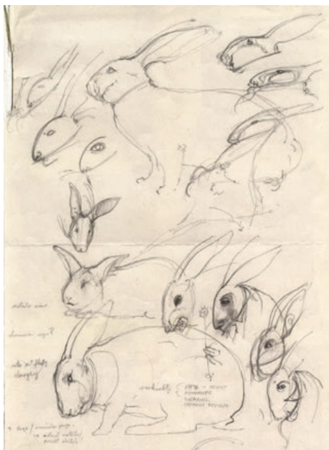
»Übungen, um als Künstler fit zu bleiben« – ein frühes Stadium eines Tierentwurfs. Aus »Der Vogelkönig und andere Skizzen« von Shaun Tan, Carlsen 2011

Es ist die Vieldeutigkeit, die die Illustrationen so spannend macht und den flüchtigen Zeichnungen Dynamik verleiht. Dazu trägt etwa auch die Verwendung von Farbe